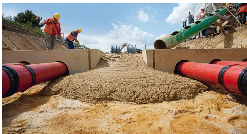
FDS 0/4 - FLÜSSIGBODEN - DIABAS SAND