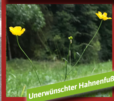
Vor BIOLIT Behandlung