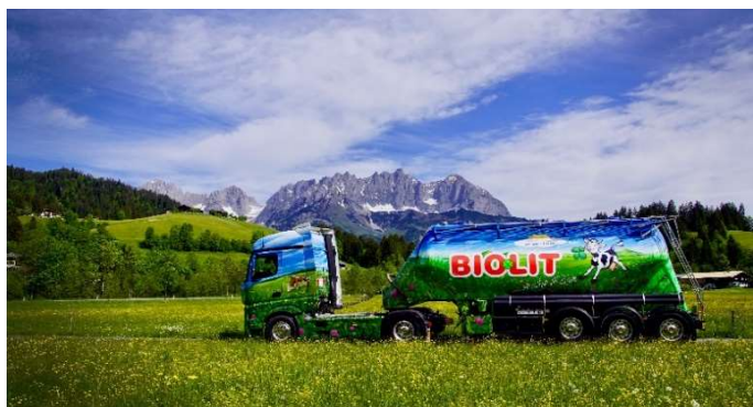
BIOLIT SILO LKW